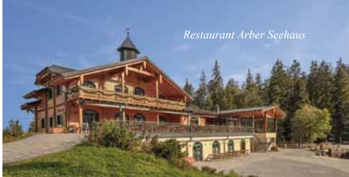
Restaurant Arber Seehaus

Unsere Ausfahrten starten jeweils direkt am Hotel und führen uns am ersten Veranstaltungstag gleich zum höchsten Berg des Bayerischen Waldes und von Niederbayern. Der Große Arber mit 1455 Meter Höhe bietet