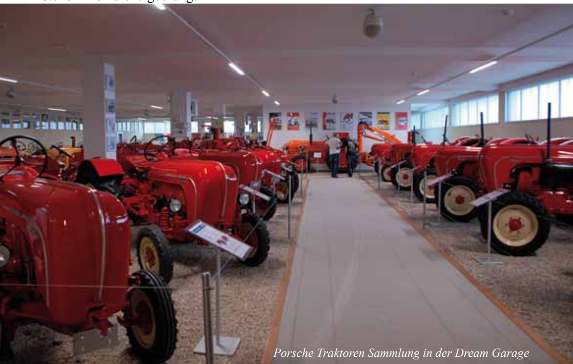
Porsche Traktoren Sammlung in der Dream Garage

Burger, Spareribs, Hot Dog, Chicken-Wings, alles was ungesund ist und gut schmeckt steht an diesem Abend auf der Speisekarte. Natürlich gibt es für Vegetarier auch fleischlose Hallouni-Burger oder eben einen leckeren Cesar Salad.