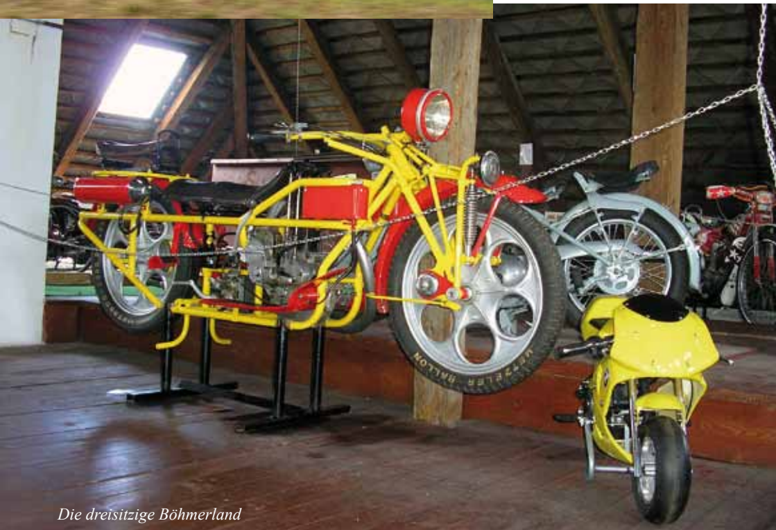
Die dreisitzige Böhmerland