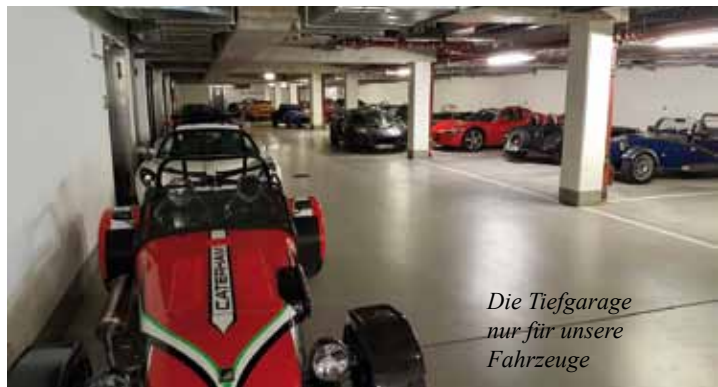
Die Tiefgarage nur für unsere Fahrzeuge

sicher und trocken in der großen Tiefgarage und für alle übrigen Autos sowie Trailer gibt es einen Schrankenparkplatz in unmittelbarer Nähe. Das Hotel verfügt über 80 Doppel- sowie 6 Einzelzimmer. Sollte die Kapazität nicht ausreichen können im Hotel Brandl noch weitere 20 Doppel- sowie 3 Einzelzimmer hinzugebucht werden.