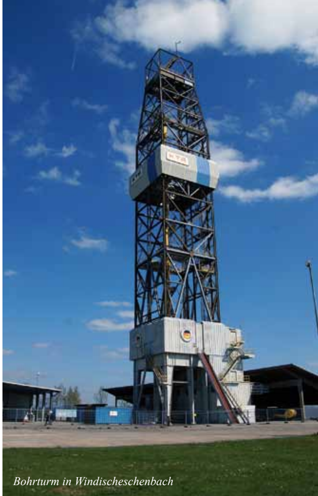
Bohrturm in Windischeschenbach

Diese führt uns entlang des Regens zur Firma Bavaria Classic in Regenstauf. Hier hat man sich ganz der Restauration alter Fahrzeuge verschrieben und bietet von der